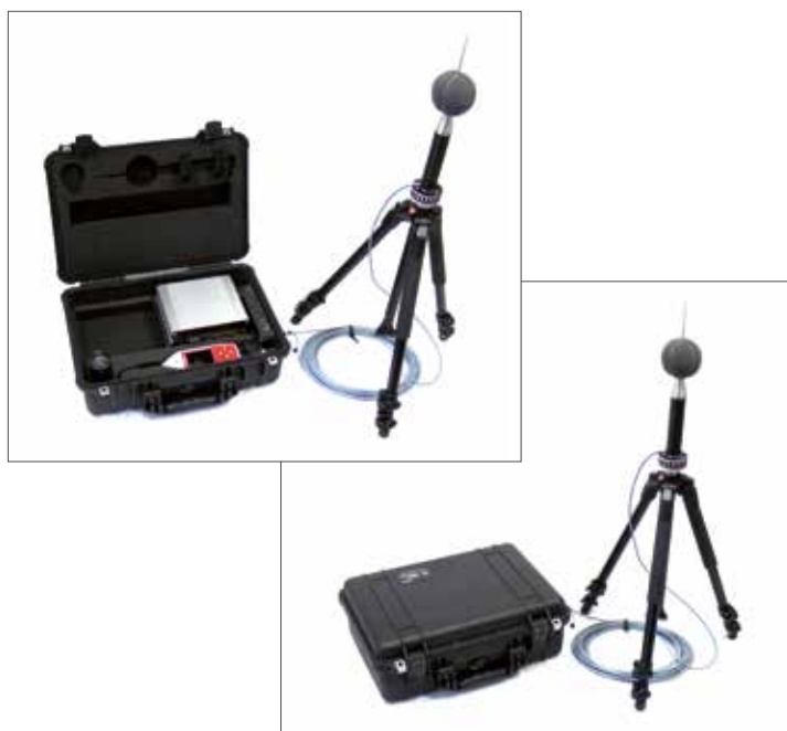
Kit de exteriores CK:670 con trípode opcional CT:7

NoiseTools mostrará símbolos de verificación si la información coincide, una característica exclusiva que será muy útil en procedimientos legales.